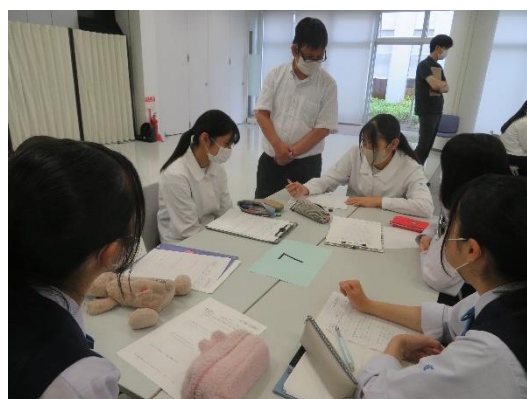
グループワークで豊田高校の危険個所を考え中