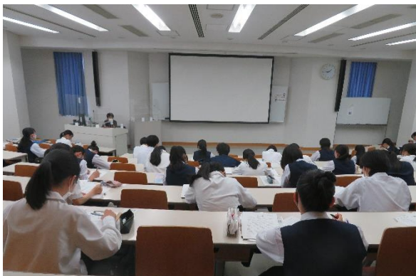
真剣に講義を聞いている様子